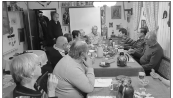
Weihnachtsfeier 2022 in der Frankenstube

Wir treffen uns am Freitag, 8. Dezember um 19.00 Uhr wieder zu unserer alljährlichen vorweihnachtlichen Besinnungsstunde. Auch werden wir Bilder von diversen Veranstaltungen (Studienreise, Freizeit sowie Gruppenstunden u.v.a.) bei einem Rückblick betrachten. Diese letzte Zusammenkunft in diesem Jahr findet wieder in der „Frankenstube“ statt.