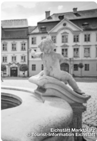
Eichstätt Marktplatz