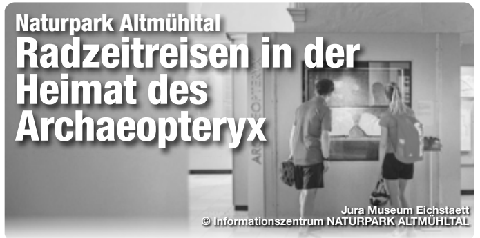
Jura Museum Eichstätt

Von den Lagunen eines subtropischen Meeres auf den Grund eines gigantischen Stromes, an den Rand eines gewaltigen Einschlagskraters und aufs Dach eines unterirdischen Labyrinths reisen Entdecker im Naturpark Altmühltal. Die Erdgeschichte ist hier in Bayerns Mitte vielerorts zum Greifen nah, sodass Ausflüge zu faszinierenden Touren durch die Jahrmillionen werden. Ein neuer Wegweiser zu den geologischen Höhepunkten der Region ist der GeoRadweg Altmühltal, der im Sommer 2022 offiziell eröffnet wurde.