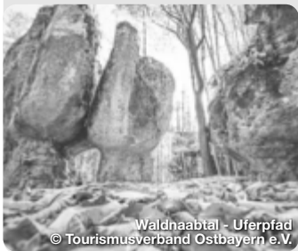
Waldnaabtal - Uferpfad

Herrlich entspannte Urlaubstage genießen im Naturpark Altmühltal. In sanften Kurven schlängelt sich die Altmühl durch eine Landschaft, die ideal ist für Aktive und Naturgenießer. Vorbei an Jurafelsen und sonnigen Wacholderheiden fahren Radwanderer auf einem der beliebtesten Radwege Deutschlands, dem Altmühltal-Radweg. Auf 166 Kilometern folgt er dem Fluss von Gunzenhausen aus durch den Naturpark Altmühltal bis zur Donau in Kelheim. Der Altmühltal-Radweg ist eine fabelhafte Route für Genussradler: naturnah, eben und stressfrei fernab des Straßenverkehrs. Der perfekte Weg für entspannte und entspannende Wanderungen im Naturpark Altmühltal ist der Altmühltal-Panoramaweg. TreffpunktDeutschland.de/altmuehlal