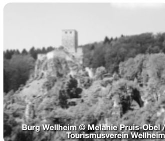
Burg Wellheim

Das Urdonautal rund um Wellheim, über dem weithin sichtbar die majestätische Burgruine thront, liegt als Ausläufer des Altmühltals zwischen Eichstätt und Neuburg/Donau. Es gehört zu den 100 schönsten Geotopen Bayerns und ist mit zahlreichen gut ausgeschilderten Wanderwegen ein tolles Ausflugsziel für alle Naturliebhaber. Hier entspringt die Schutter, die sich durch das romantische Tal bis nach Ingolstadt schlängelt. Auf dem zertifizierten Qualitätswanderweg Urdonautalsteig finden Sie ein ganz besonderes Wandererlebnis durch Wälder, über Trockenrasenhänge und vorbei an beeindruckenden Felsformationen mit vielen spektakulären Aussichtspunkten sowie Kultur- und Natursehenswürdigkeiten. TreffpunktDeutschland.de/wellheim