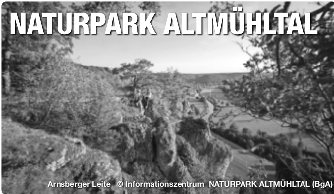
Arnsberger Leite

Alle Termine und Angaben unter Vorbehalt!